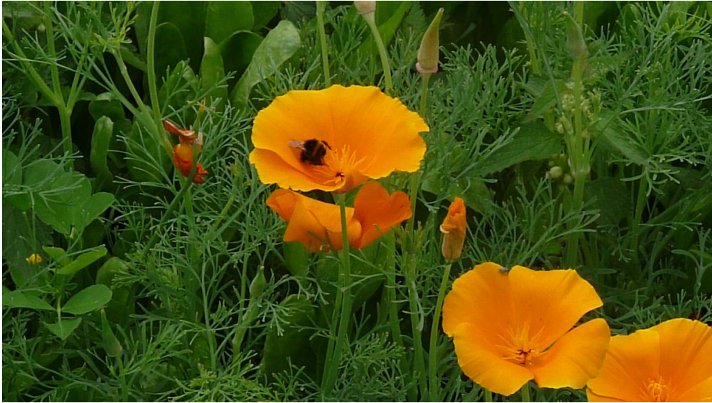
Pavot de Californie

Le Pavot de Californie appartient à la même famille que les Coquelicots. Ils produisent un pollen très apprécié par les insectes pollinisateurs et se ressèment spontanément au potager. Les fleurs peuvent être utilisées en infusion pour lutter contre l'insomnie.